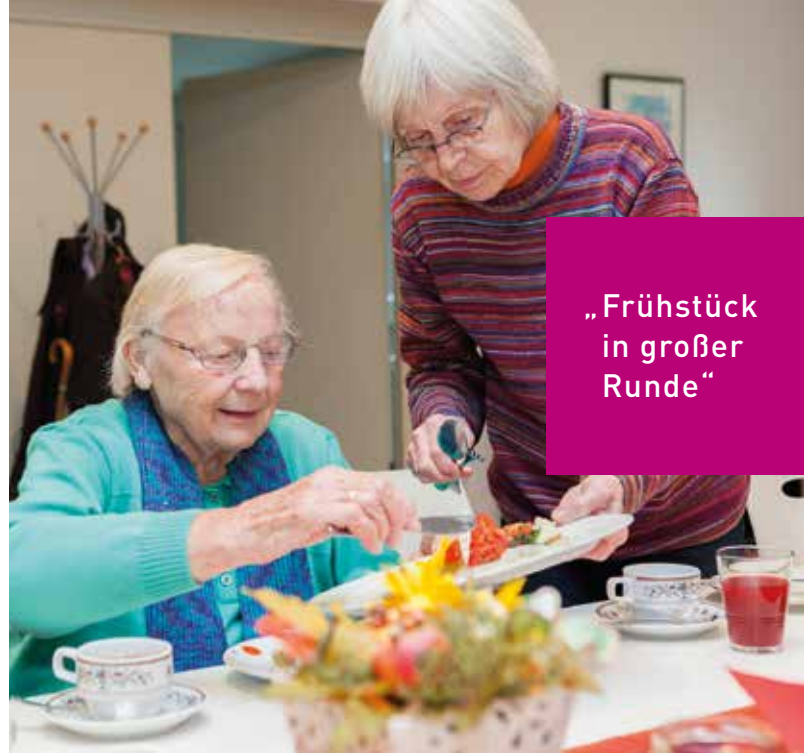
„Frühstück in großer Runde“