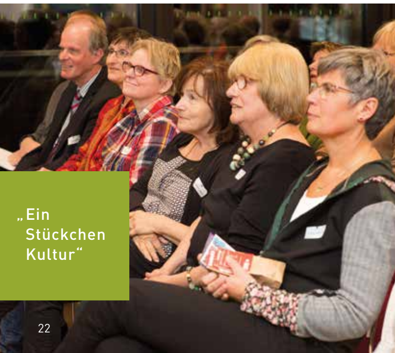
„Ein Stückchen Kultur“

Kosten: 5 Euro (für Begleitpersonen frei)